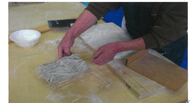
《そば打ち体験の様子》

昨年12月18日、福島空港公園緑のスポーツエリア・21世紀建設館で、「NPO法人はばたけ21夢飛行」主催による「そば道場」が開催されました。当日は、小野町の「小町湯沢そばの会」の方が指導されていました。参加者は趣味でそば打ちをしている方が多く、水の分量など細かい点を熱心に聞いていました。参加者は、「自分で打ったそばを、年末に家族や友達に振る舞うことが楽しみ」と笑顔で話していました。