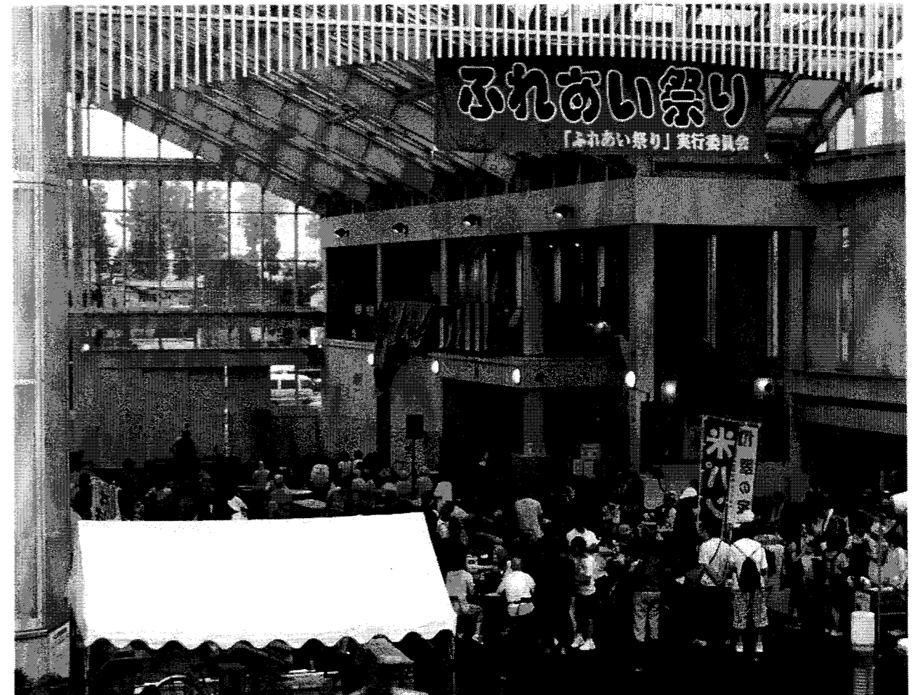
9月12日(日) ふれあい祭りがまちなかプラザにて開催されました。