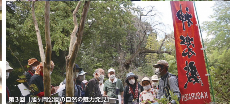
第3回「旭ヶ岡公園の自然の魅力発見」