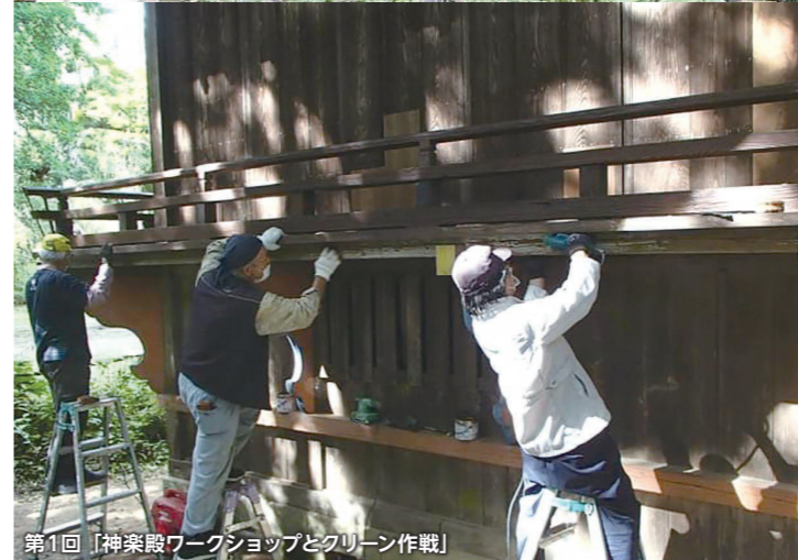
第1回「神楽殿ワークショップとクリーン作戦」