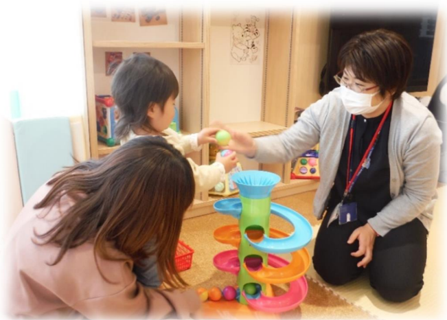
(令和 4 年 4 月子育て支援相談会より)